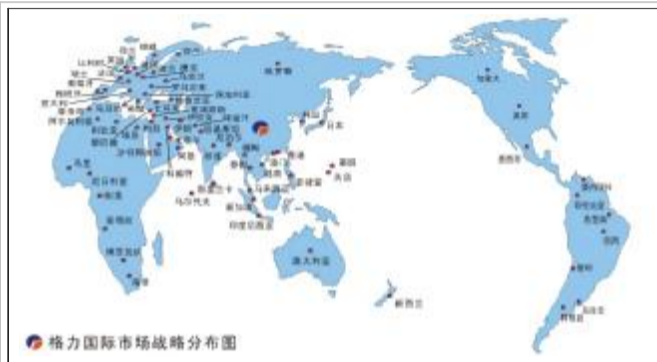
格力国际市场战略分布图